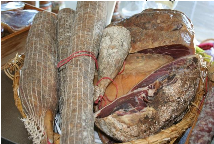
5. kép termelői csoport húsüzemében készült szárazáru a csoport által üzemeltetett boltban

A megyei agrárkamara 6,1 millió euróból gazdálkodik, 70 teljes munkaidős alkalmazottnak megfelelő állományt foglalkoztat. A gazdák 82%-ával közvetlen kapcsolatuk van, cél, hogy minél közelebb legyenek a terepen dolgozó termelőkhez – ennek alapvető eszköze a kamarai tanácsadói hálózat. A tanácsadók nem csak a napi munkához szükséges információkkal látják el a gazdákat, de ők végzik például a fiatal gazda-jelöltek pályakezdési projektjeinek előzetes értékelését is. Nagyon fontos szerepük van a termőföld-használati stratégiák kidolgozásában és megvalósításában, ezen belül is elsősorban a művelés alóli kivonások engedélyezésében. A hatóságok ugyanis az egyes kérelmek kapcsán kötelező jelleggel kikérik a kamara véleményét, és ha a kamara nemet mond, akkor a kérelmező biztos lehet abban, hogy semmilyen hatóság nem fogja megadni az engedélyt. A kamara társtulajdonos abban a cégben, amit azért hoztak létre, hogy a termelői termékek közvetlen értékesítését elősegítse a közintézményi kantonok felé, illetve ezen keresztül ösztönözze a helyi termékek földolgozását nagy hozzáadott-értéket képviselő termékekké. A kamarának köszönhetően az informatika a környezetvédelemben és a tápanyag-gazdálkodás optimalizálásában is fontos szerepet játszik, már mobiltelefonon is működik a szerveztrágya-kijuttatással kapcsolatos program, ami a talaj N-tartalmának és a klimatikus viszonyok figyelembe vételével jelzi ennek ajánlott időpontját.